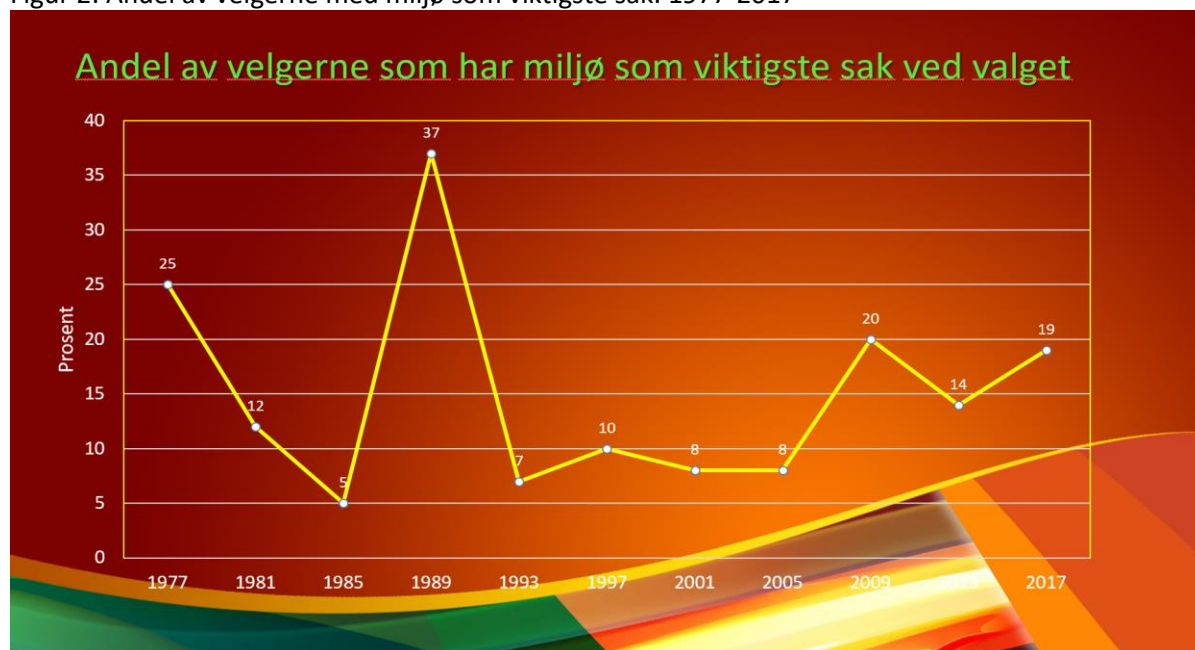
Figur 2: Andel av velgerne med miljø som viktigste sak. 1977-2017

Kilde: Valgundersøkelsene, Institutt for samfunnsforskning / Statistisk sentralbyrå